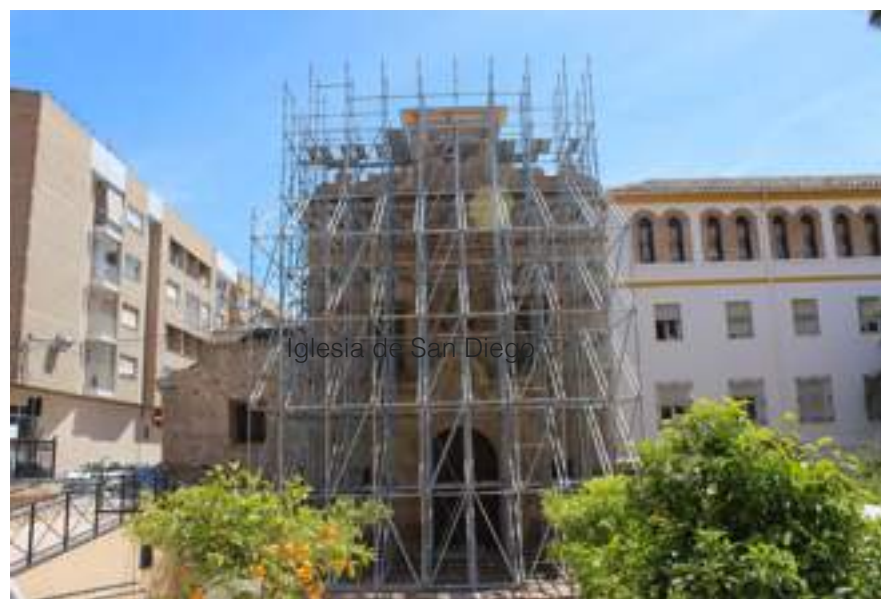
Iglesia de San Diego

Mientras la iglesia de San Diego, San Francisco, Santiago, San José, Cristo Rey, tienen la financiación, pero aún no están reconstruidas.