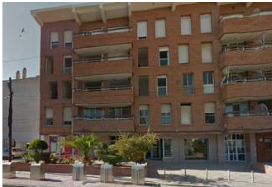
Edificio a la espera de ser derribado

Normalmente, dependiendo del tipo de edificio, tardan unos 18 meses para reconstruir la vivienda.