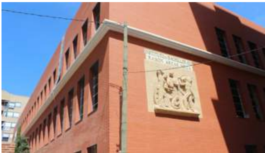
IES Ramón Arcas

En cuanto a las obras en centros educativos, de los 23 centros del municipio, se han realizado obras de rehabilitación. En el IES Ramón Arcas está en fase de reconstrucción y el IES Ros Giner, en espera de ser adjudicado por una empresa, para ser reconstruido.