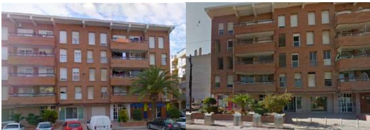
Avenida de las Fuerzas Armadas