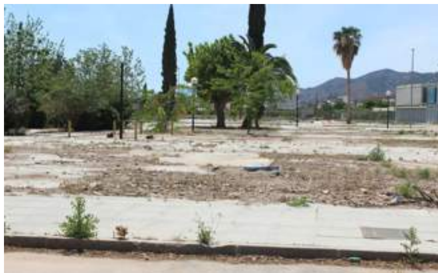
Solar, Barrio San Fernando

El barrio de San Fernando estaba compuesto por 232 viviendas, distribuidas en 15 escaleras y 9 edificios, sufrieron importantes daños a consecuencia de los seísmos y se tuvo que proceder a su demolición para garantizar la seguridad de los vecinos. Después de tres años, las obras tienen una empresa adjudicada y su correspondiente licencia, con un presupuesto de más de dos millones de Euros. Aún no han comenzado las obras y los vecinos de San Fernando no aguantan más la situación, porque muchos de ellos viven en una situación trágica, teniendo que enfrentarse al pago de la hipoteca de un solar vacío, junto con el del alquiler, ya que según informan vecinos del barrio de San Fernando, las ayudas de los últimos meses aún no han llegado.