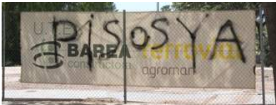
Barrio San Fernando