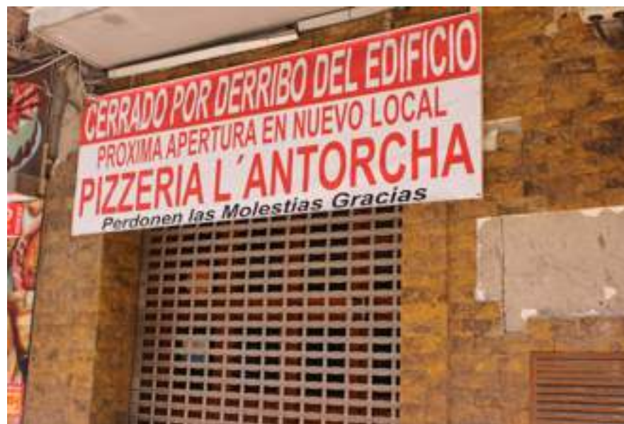
Local cerrado por el estado de su edificio, en la actualidad.

La iglesia de Santiago creen que estará terminada para el verano.