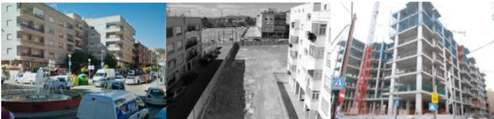
Calle Jardineros - La Viña