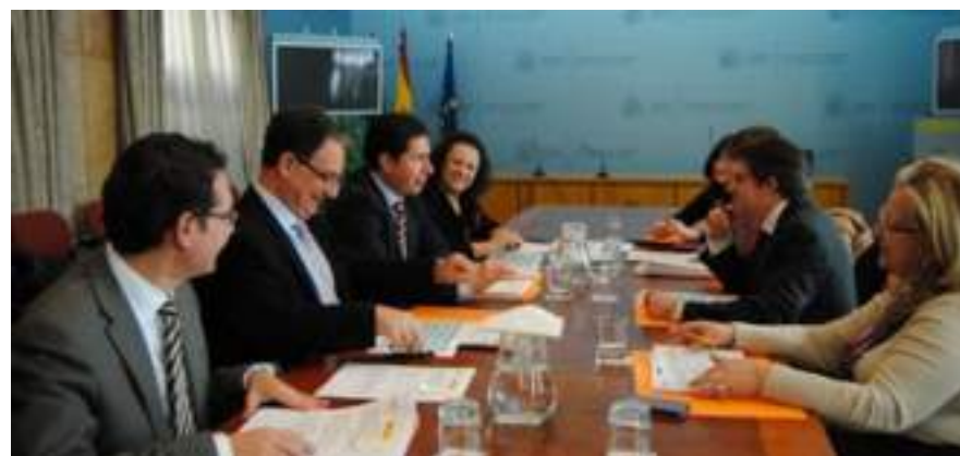
Reunión de la Comisión Mixta

“Para la valoración, determinación y cuantía de las ayudas concedidas a particulares, en virtud de las solicitudes presentadas, por arrendamiento, reconstrucción, rehabilitación o reparación de viviendas que constituyan su domicilio habitual, se creará una comisión mixta comprendida por el Delegado del Gobierno en la Comunidad Autónoma de la Región de Murcia y el Consejero de Obras Públicas y Ordenación del Territorio de dicha Comunidad Autónoma, y compuesta por un representante de la Administración General del Estado, un representante de la administración autonómica y un representante del Ayuntamiento de Lorca.