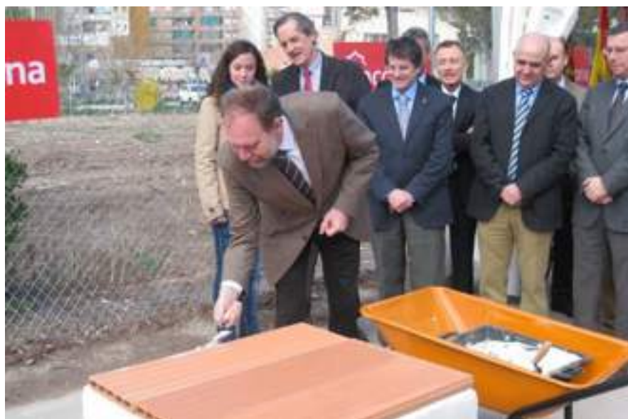
14 de marzo de 2013